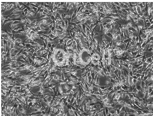
OriCell® U-118 MG 细胞系在倒置相差显微镜下的形态

注意： 本产品在生产过程中严格控制无菌。后续培养请根据实际情况选择是否添加抗生素。