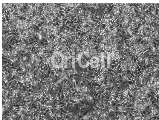
OriCell®大鼠心肌细胞在倒置相差显微镜下的形态