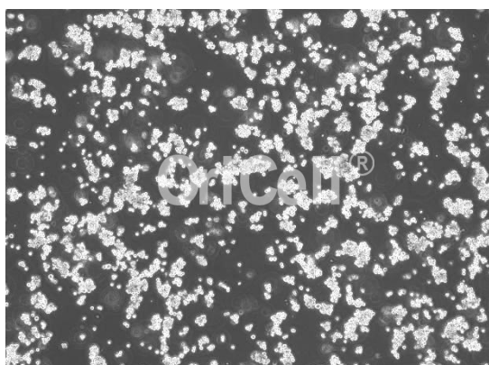
OriCell® LLC-WRC 256[Walker 256]细胞系在倒置相差显微镜下的形态

注意： 本产品在生产过程中严格控制无菌。在后续培养过程中，请根据实际情况决定是否在培养基中添加抗生素。