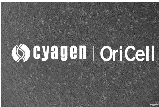
OriCell® Panc 03.27 细胞系在倒置相差显微镜下的形态