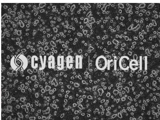
OriCell®Balb/c 小鼠胚胎干细胞在倒置相差显微镜下的形态