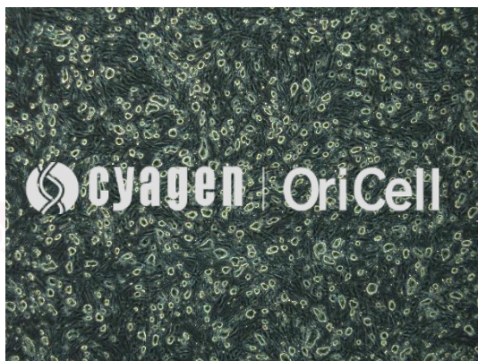
OriCell®C57BL/6 小鼠胚胎干细胞在倒置相差显微镜下的形态