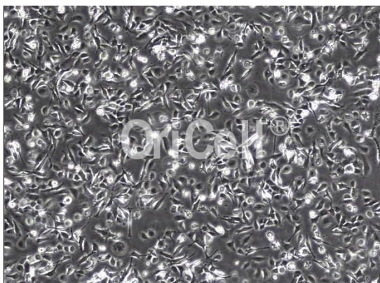
OriCell® HMC3 细胞系在倒置相差显微镜下的形态

注意： 本产品在生产过程中严格控制无菌。后续培养请根据实际情况选择是否添加抗生素。