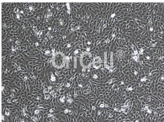
OriCell® MNNG/HOS Cl #5 细胞系在倒置相差显微镜下的形态

注意： 本产品在生产过程中严格控制无菌。后续培养请根据实际情况选择是否添加抗生素。