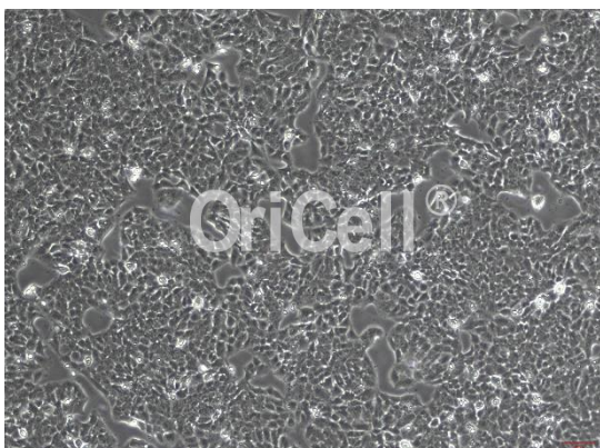
OriCell® MS751 细胞系在倒置相差显微镜下的形态

注意： 本产品在生产过程中严格控制无菌。在后续培养过程中，请根据实际情况决定是否在培养基中添加抗生素。