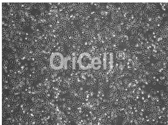
OriCell® A875 细胞系在倒置相差显微镜下的形态

注意： 本产品在生产过程中严格控制无菌。后续培养请根据实际情况选择是否添加抗生素。