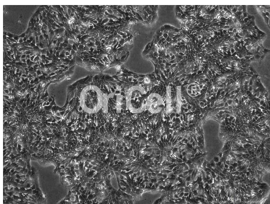
OriCell® A-431 细胞系在倒置相差显微镜下的形态

注意： 本产品在生产过程中严格控制无菌。后续培养请根据实际情况选择是否添加抗生素。