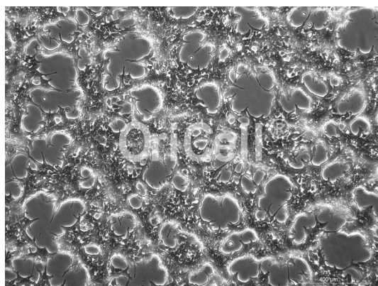
OriCell® 293FT 细胞系在倒置相差显微镜下的形态

注意： 本产品在生产过程中严格控制无菌。后续培养请根据实际情况选择是否添加抗生素。