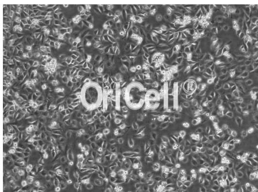
OriCell® HLF 细胞系在倒置相差显微镜下的形态

注意： 本产品在生产过程中严格控制无菌。后续培养请根据实际情况选择是否添加抗生素。