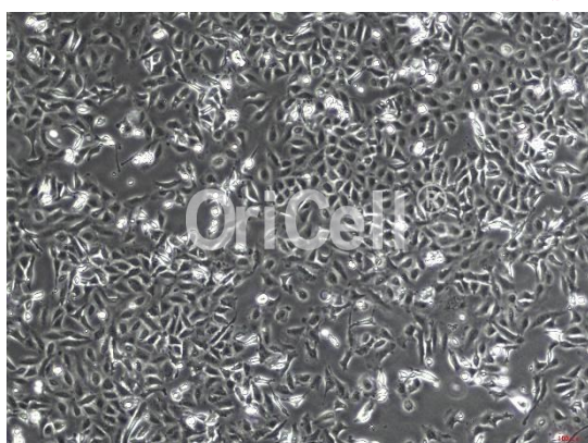
OriCell® HPDE6-C7 细胞系在倒置相差显微镜下的形态

注意： 本产品在生产过程中严格控制无菌。在后续培养过程中，请根据实际情况决定是否在培养基中添加抗生素。