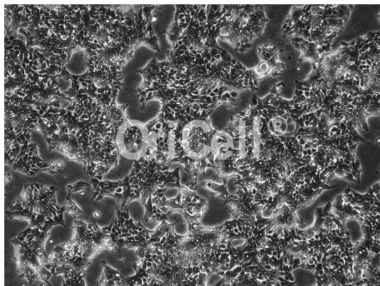
OriCell® HCC827 细胞系在倒置相差显微镜下的形态

注意: 本产品在生产过程中严格控制无菌。在后续培养过程中, 请根据实际情况决定是否在培养基中添加抗生素。