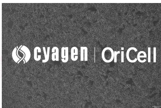
OriCell® CAL-33 细胞系在倒置相差显微镜下的形态