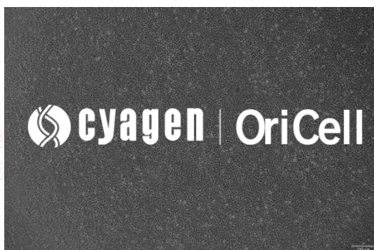
OriCell® ATDC-5 细胞系在倒置相差显微镜下的形态